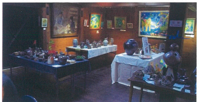
絵画・陶器展実施イメージ